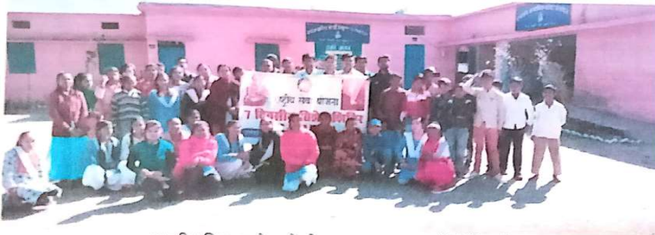
शामकीय विद्यालय के बच्चों को स्वच्छता का पाठ पढ़ाने शिविरार्थी